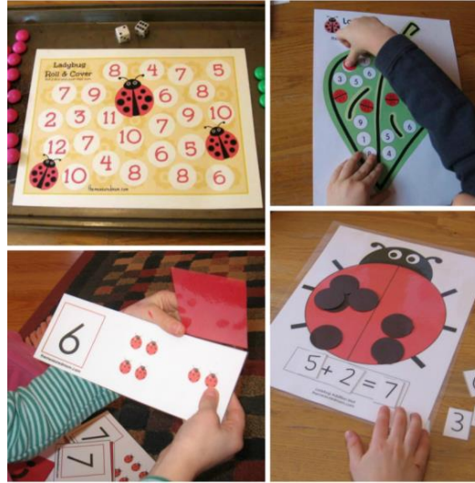
Resim 1.1: Matematik Etkinliği

Uygulanan matematik etkinlikleri ile; çocukların çevrelerindeki örüntüleri fark etmeleri, varsayımlar geliştirerek bunları deneyebilmeleri, problem çözebilmeleri, akıllı yürütebilmeleri ve matematiksel kavramları kullanarak iletişim kurabilmeleri sağlanır.