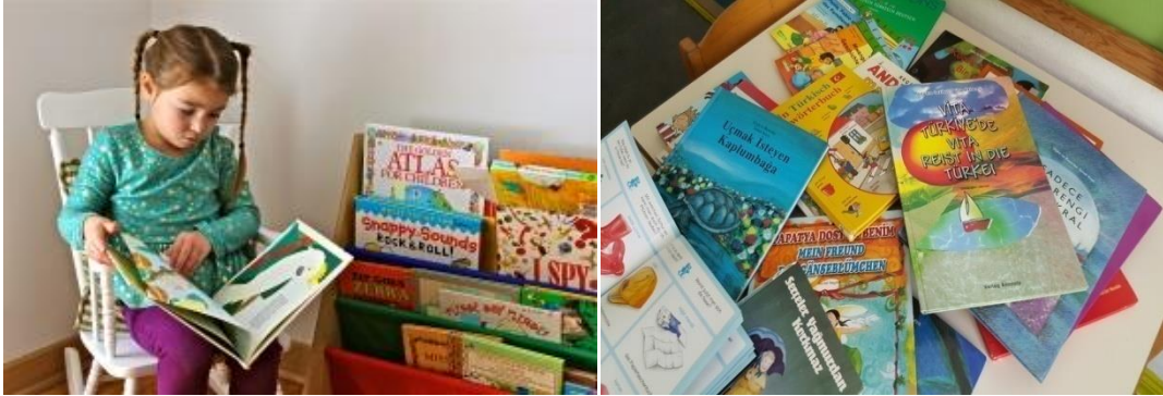
Resim 2.12: Kitap Merkezinde Materyaller

Çocukların ulaşabileceği yükseklikte kitaplık-raflar, resimli kitaplar, sandalye-koltuk, minderler, masa, broşürler, dergiler, ansiklopediler, atlaslar, kataloglar, farklı boyutlarda resimli kartlar, yazılı materyaller, gazete, farklı temalara uygun olarak hazırlanmış afişler, ABC kitapları, kumaş kitaplar, çocukların hazırladığı kitaplar, haritalar, büyüteçler, restoran menüleri, telefon rehberi, hikâye ve masal kahramanlarının maketleri, üç boyutlu resimli kitaplar, hikâyelerin anlatıldığı CD'ler, bilgisayar, yansı cihazı, masa lambası, bilmece kitapları veya kartları, boyama kitapları, tekerleme, şiir kitapları, biyografiler ve kavram kitapları, bellek kartları, kavram oyuncakları vb. bulundurulabilir.