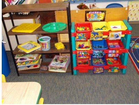
Resim 2.8: Manipülatif Oyun Merkezi

Çocukların sayıları tanıma, sınıflandırma, gruplama, parçalardan bütün oluşturmalarını sağlayan, düşünme, karar verme, akılda tutma gibi zihinsel işlevleri geliştiren bir merkezdir.