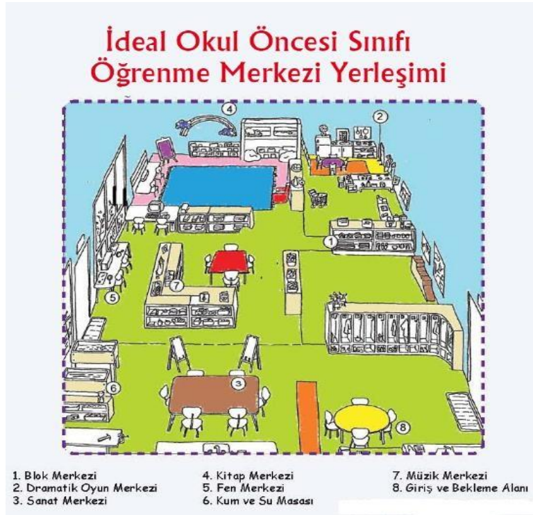
Resim 2.11: İdeal okul öncesi sınıfı öğrenme merkezi yerleşimi

Etkinlik 2.1: Çevrenizde bulunan bir okul öncesi eğitim kurumuna giderek öğrenme merkezlerini inceleyiniz. İncelediğiniz öğrenme merkezlerinin bir krokisini çiziniz. Çizdiğiniz krokiyi sınıfta öğretmen ve arkadaşlarınıza sunarak görüş alışverişinde bulununuz.