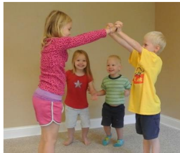
Resim 1.6 : Oyun Etkinliđi

Oyun; çocukların hareket gereksinimini karřılar ve oynanan oyunun türüne göre hayal dünyasını da zenginleştirir. Çocukların oyun ihtiyacını karřılayabilmek için günlük eğitim programı kapsamında farklı türlerde, farklı kazanımlara hizmet edecek çeřitli oyun fırsatları sunmak önemlidir.