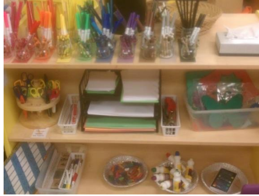
Resim 2.4: Sanat Merkezi

Dönem başında ve daha küçük yaş gruplarında daha basit materyaller ile başlanması ve çocukların beceri düzeyleri arttıkça materyallerin de daha karmaşıklaşması gerekir. Çocukların ürettiği ürünlerin çocukların göz hizasında ve çocuklar tarafından sergilenmesine özen gösterilmelidir.