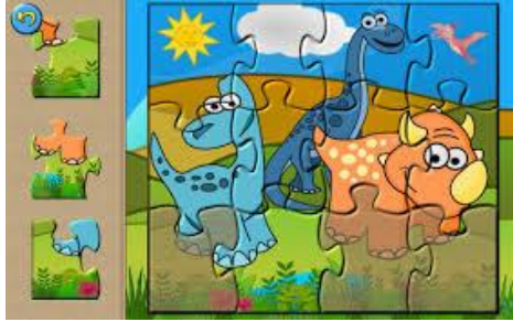
Resim 2.18: Parça-Bütün Kavramı İçin Bilgisayar Programı

Bilgisayarlar, masa ve sandalyelerin yanı sıra çocukların yaş ve gelişim düzeylerine uygun bilgisayar programları bulundurulur. Öğretmen etkinliklerde vereceği bir çok kavramı bilgisayar programları sayesinde pekiştirebilir.