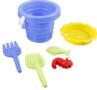
Resim 2.17: Kum-Su Oyun Materyalleri