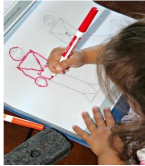
Resim 1.3: Okuma -Yazmaya Hazırlık Etkinliđi

Okul öncesi eğitimde amaç, çocuklara ilkokulda okuma ve yazmayı öğrenebilmesi için gereken ön becerileri kazandırmaktır. Çocukların öncelikle, okuma yazmanın gerekliliđini ve gerçek yaşam ile ilişkisini anlamaları önemlidir. Böylece çocukların okuma yazmaya ve okula karşı olumlu bir algı geliştirmeleri desteklenecektir. Okuma yazma için farkındalık yaratmak ve heveslendirmek yapılacak çalışmaların amacına ulaşabilmesi açısından son derece önemlidir.