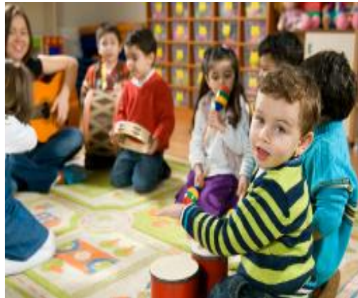
Resim 1.7: Müzik Etkinliği

Çocukların kendilerini sözel olarak kolayca ifade edemediği durumlarda, müzik etkinlikleri sosyal ve duygusal gelişimlerini destekleyerek özgüven kazanmalarına yardımcı olur.