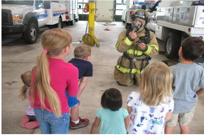
Resim 1.10: Alan Gezisi

Çocukların ilgisini çekecek yöresel, kültürel, mesleki ve güncel önem taşıyan her mekân çocuk için doğal öğrenme alanlarıdır. İçinde bulunulan yöredeki tarihî yerler, müze, matbaa, tarla, bahçe, park, farklı meslek guruplarına ait iş yerleri ( postane, itfaiye vb), herhangi bir materyalin, araç gerecin üretim atölyesi gibi mekânlara alan gezileri düzenlenebilir.