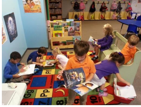
Resim 2.2: Kitap Merkezi