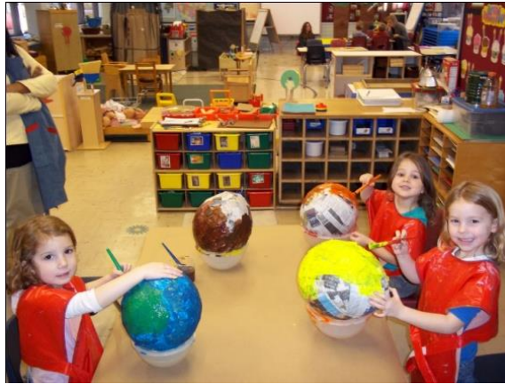
Resim 1.4: Sanat Etkinliği

Çocuğun yaratıcılığını, hayal gücünü ve el becerilerini kullanarak ürünler oluşturmasına olanak tanıyan etkinliklerdir. Sanat etkinlikleri aynı zamanda çocukların yeteneklerini keşfederek kendilerini ifade etmelerine fırsat verir.