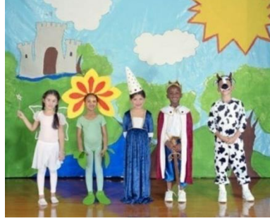
Resim 1.2: Drama Etkinliđi

Deđerlendirmede çocuklardan süreç ile ilgili afiş hazırlamaları, resim yapmaları gibi farklı çalışmalar yapmaları da istenebilir. Bu tarz çalışmalar onların hayal gücünü ve ifade yeteneklerini geliştireceğinden tercih edilmelidir.