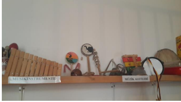
Resim 2.13: Müzik Merkezinde Materyaller