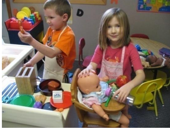
Resim 2.6: Dramatik Oyun Merkezi

Oyun, çocuğun bütün gelişim alanlarını destekler. Çocuklar dramatik oyun merkezinde aldıkları çeşitli rollerle hayal güçlerini de kullanarak değişik oyunlar oynarlar. Bazen anne, baba, çocuk, hemşire, doktor, öğretmen gibi çeşitli kimliklerle gelecekte üstlenecekleri rollere hazırlanırlar. Çocuk bu merkezde kendi kendine ya da arkadaşlarıyla oyun oynarken hayal gücünü geliştirir. Paylaşma, yardımlaşma ve kurallara uyma gibi pek çok sosyal davranışı kazanır.