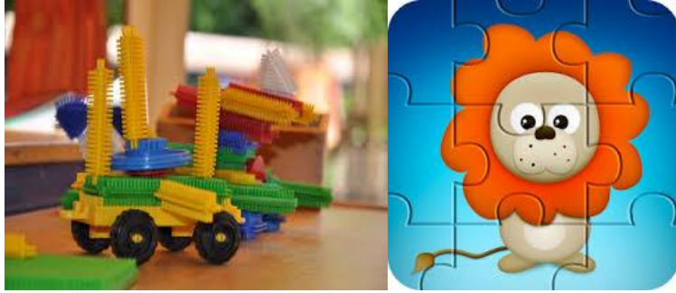
Resim 2.16: Manipülatif Oyun Materyalleri

Çocuklarda problem çözme, kavram oluşumu gibi birtakım zihinsel yeteneklerinin gelişimine yardımcı olan bu merkezde; Sayı kartları, (karton, mukavvadan, tahtadan sayılar), eşleştirme kartları, sıralama kartları, şekil kartları, boncuklu abaküs, üç boyutlu nesnelere, renkli küçük tahta bloklar, Legolar, dominolar, memory kartları, yap-bozlar, noperler, takıp çıkarmalı oyuncaklar, yazı tahtası vb. yer alır.