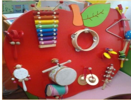
Resim 2.3: Müzik Merkezi

Çocukların müzik ile ilgili bilgi ve becerilerini destekleyerek deneyim kazanmalarını sağlayan etkinliklerin yapıldığı bir öğrenme merkezidir. Okul öncesi eğitim kurumunda müzik merkezinin olması, çocukların hem erken dönemde müzik eğitimiyle ilgili bireysel bilgi ve becerilerinin oluşmasını ve gelişmesini sağlayacak hem de genel müzik kültürünün oluşmasına katkıda bulunacaktır. Bu merkezde özellikle gerekli çalgı ve araç gereçlerin bulundurulması ve bunların hem çocuklar hem de öğretmenler tarafından etkin bir şekilde kullanılması, ritim duygusunun gelişebilmesi ve işitsel algının uyarılması açısından önemlidir. Çocuk bu merkezdeki çalgı ve araç gereçler yardımıyla bilişsel, dil, motor, sosyal ve duygusal becerilerini artırmaya yönelik çalışmalar da yapabilecektir. Ayrıca öğretmen çocuklarla birlikte artık materyallerden farklı sesler çıkaran müzik araç gereçleri yapmaya da özen göstermelidir.