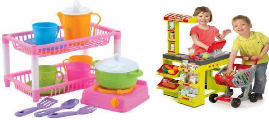
Resim 2.15: Dramatik Oyun Materyalleri