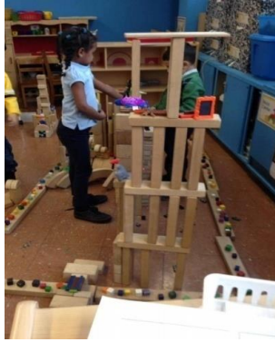
Resim 2.1: Blok Merkezi

Çocukların yaşadıkları ortamlarda yer alan farklı boyut, şekil ve renkteki figürleri ve bunlar arasındaki ilişkileri fark etmesine ve farklı figürler kullanarak yapı-inşa oyunları aracılığıyla yaratıcılıklarını kullanmasına olanak tanıyan bir merkezdir. Bu merkez için geniş bir alana ihtiyaç vardır ve çocuklar hareketli olup çok ses çıkarabilecekleri için sessiz olunması gereken merkezlerden uzak olmalıdır.