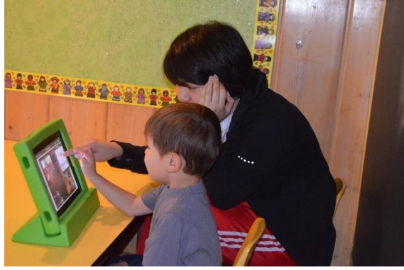
Resim 2.10: Bilgisayar Merkezi

3-4 yaş gelişimsel olarak çocukların bilgisayarı keşfetmeye hazır oldukları dönemdir. Bilgisayar merkezinde öğretmenin yardımıyla çocuklara; uzun süreli bellek becerilerinin, el-göz koordinasyonunun, sözel becerilerin, problem çözme, soyutlama ve kavramsal becerilerin kazandırılması mümkündür.