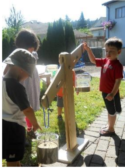
Resim 1.8: Fen Etkinliđi

Bu etkinliklerle yaşam gerçeklerini tanıtırken çocuklarda çevre farkındalıđı da sağlanacaktır. Çocukların çevrelerine karşı doğru tutumlar geliřtirebilmeleri ve doğru davranabilmeleri için öđretmenin tutumlarının da doğru olması ve doğru davranması gerektiđi unutulmamalıdır.