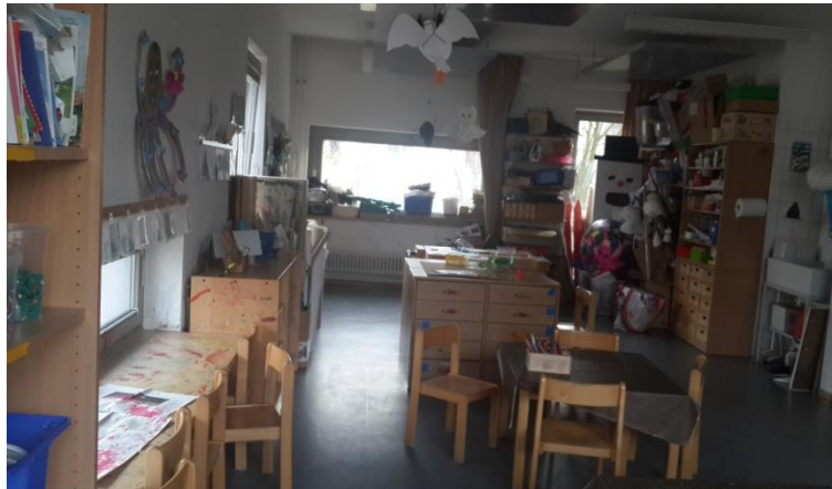
Resim 2.14: Sanat Merkezinde Materyaller

Pastel boya, kuru boya, gazlı kalem, sulu boya, akrilik boya, tutkallı boya, beyaz kâğıt, renkli fon kartonları, rulo kraft kâğıtları, naylon poşetler, köpük (strafor) panolar, kumaş, cam, metal yüzeyler, düz taşlar, şişe kavanoz ve çeşitli büyüklükte karton kutular, kâğıt bardaklar, desenli duvar kâğıtları, kap kâğıtları, gazete dergi, ahşap boyama materyalleri, her türlü kolaj (kesme yapıştırma) malzemeleri, değişik renk ve desende kâğıtlar, alüminyum folyo, yoğurma materyali olarak oyun hamurları, kil, yapıştırıcı olarak beyaz (plastik) tutkal, makaslar, kâğıt peçete ve ruloları, pipetler, kürdan, kumaş parçaları, renklendirilmiş pamuklar, şampuan şişeleri, ipler, düğmeler, alçı kalıpları, maskeler, makarnalar, boncuklar, ressamalara ait tablolar ve reproduksiyonlar, kartpostallar, posterler, gezi fotoğrafları, müze broşürleri, çıkartmalar, resimli takvimler, çocukların yaptığı resimler, sergi panosu, sanat haberlerinin yer aldığı gazete ve dergiler, çocukların çektiği fotoğraflar, proje çalışmaları, koleksiyonlar, ülkeleri tanıtan resimler, çocuklar için önlük veya eski tişörtler, palet, tuval, baskı çalışmaları için; yaprak patates, çarşaf, süngerden kalıplar, fırçalar, şövaleler vb. bulundurulabilir.