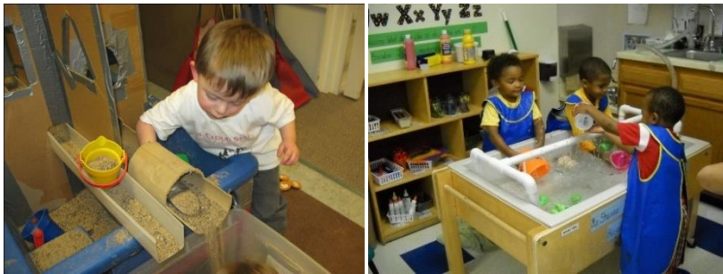
Resim 2.9: Kum ve Su Merkezi

Okul öncesi eğitim kurumlarında öğretmenin farklı zamanlarda kurup kaldırabileceği merkezlerdendir. Kum ve su havuzları çocukların rahatlamalarını sağlamakla kalmayıp yaratıcılıklarını da destekleyip bir çok kavramı yaparak ve yaşayarak öğrenmesine destek olur. Doku, miktar hacim, ağırlık, renkler gibi kavramların yanı sıra, akışkanlık, aşınma, taşınma, rüzgarın etkisi gibi birçok olayı da su ve kum masalarında keşfetmeleri mümkündür. Ayrıca su ve kum masalarındaki etkinliklerle çocuk farklı bilgiler arasında ilişki kurmayı da öğrenir.