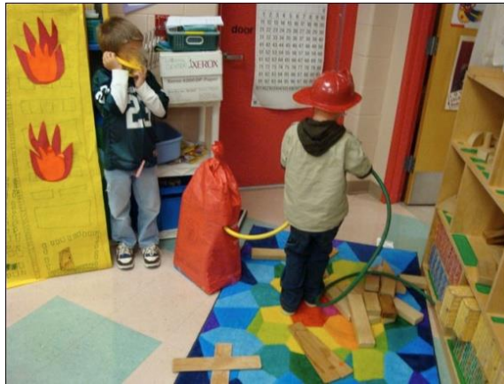
Resim 2.7: Dramatik Oyun Merkezine Oyun

Oyunu paylaşırken arkadaşlarıyla iletişim kurar. Hayal güçlerini de oyuna katarak yaratıcılıklarını geliştirirler. Tek başına ya da grupta oynanan oyunlarda çocuk bazen duygusal problemlerini, sıkıntılarını ifade ederek duygusal bir rahatlama sağlar. Bu nedenle öğretmenin dramatik oyun merkezinde iyi gözlem yapması gerekir.