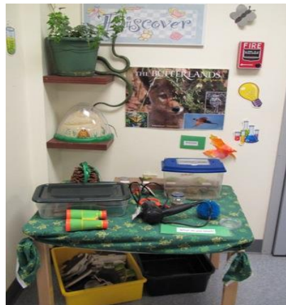
Resim 2.5: Fen Merkezi

Çocuklar dünyaya karşı içten gelen bir merak duyar ve çevrelerinde olup biteni öğrenmek ister. Bu öğrenme merkezi çocukların merak duygusu ve öğrenme arzusunu uyarmayı ve çocukların yaşadıkları dünya hakkında yeni şeyler öğrenmelerini desteklemeyi amaçlar. Çocukların bilimsel süreç becerilerini geliştirebilecekleri bu merkez, aydınlık olmalı, rahat çalışılabilecek şekilde düzenlenmeli ve görece sessiz merkezlere yakın olmalıdır.